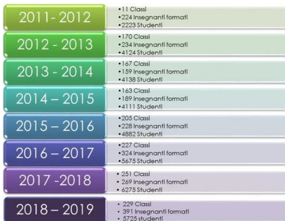
Figura 5. I numeri di impatto del programma Unplugged in Lombardia per anno scolastico

Il programma Unplugged Lombardia fin dalla sua prima attuazione ha avuto buoni riscontri e negli anni l'adesione delle scuole è andata crescendo.