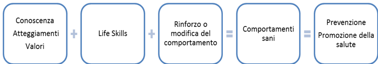
Figura 1. Modello lifeskills

L'apprendimento delle Life Skill si verifica quando le motivazioni alla conoscenza, le potenzialità e le diverse capacità possedute da una persona si traducono in comportamenti positivi e prosociali, quando, cioè, si arriva a "sapere che cosa fare e come farlo" e, soprattutto, a "essere consapevoli di saperlo fare". Per questo motivo un buon livello di acquisizione di Life Skill , contribuendo alla costruzione del senso di autoefficacia, gioca un ruolo importante nello sviluppo dell'individuo, nella tutela della salute, nella motivazione a prendersi cura di se stessi e degli altri (Boda, 2001).